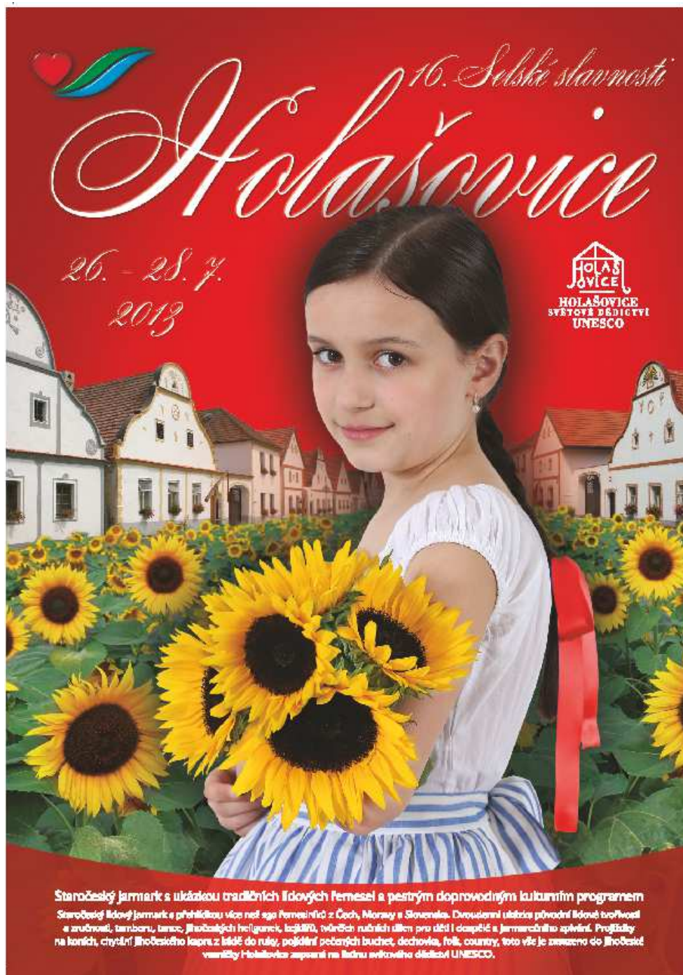
Selské slavnosti 26. – 28. 7. 2013 - Plakát